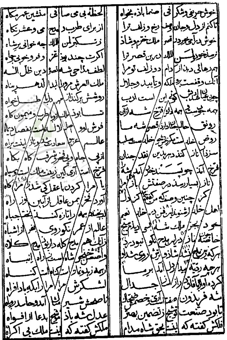
صفحه ۳۹۵ از المعجم فی معاییر اشعار العجم

۳. توشیح در ادبیات عرب در معنای دیگر مصطلح است.